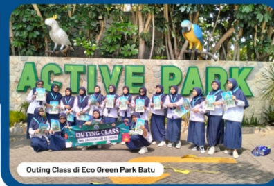
Outing Class di Eco Green Park Batu