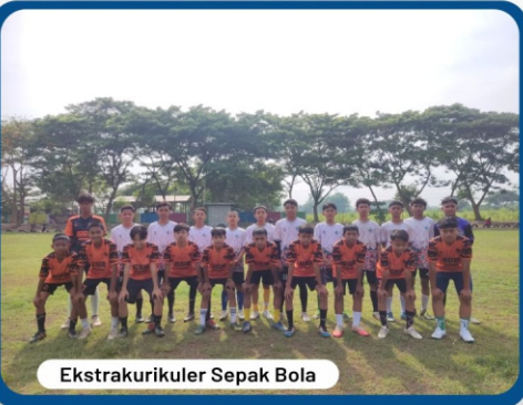
Ekstrakurikuler Sepak Bola